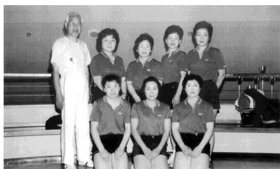
第12回 全国レディース卓球大会

以後、第2回新潟大会からは混合ダブルスへの参加者もグンと増え、我々も毎回男子卓愛会の協力が不可欠となり、成績もうなぎのぼりになりました。各種大会でも『米沢市卓愛会』は、まとまりのある強いチームと称賛されています。